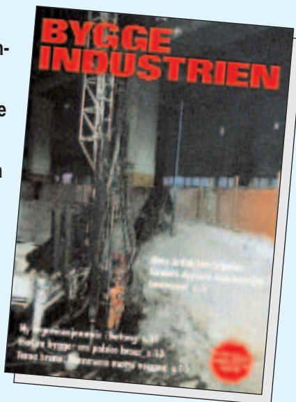
Byggeindustrien nr 2 i år fortalte om landets dypeste konstruksjon i løsmasser.

– Vi hadde gode erfaringer med jetpeling for å forlenge og forsterke fundamenter i Karbonprosjektet på Årdalstangen. Da vi begynte å vurdere metoder for hvordan vi kunne komme oss nær