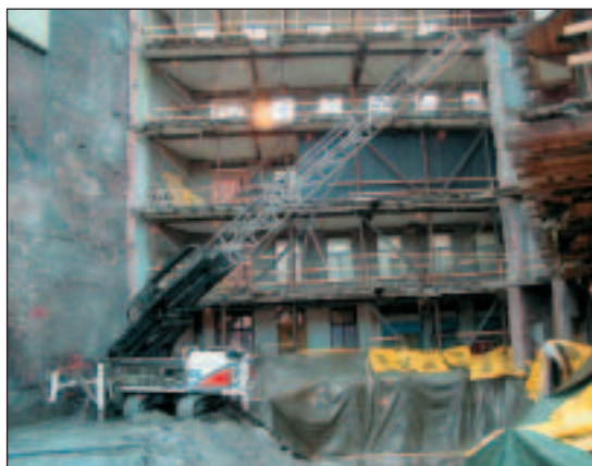
VANN. Jetgrunn 2000 AS ble innkalt for å hindre innstrømming av vann og en reduksjon av poretrykket i byggegroppen.